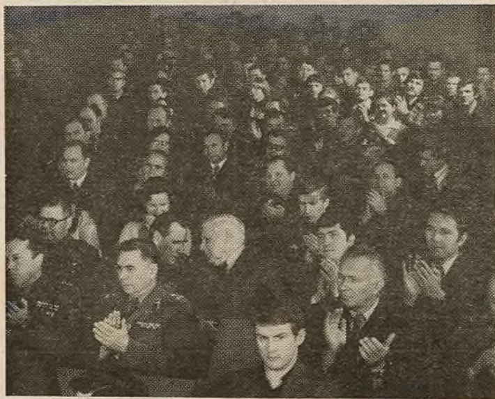
На здымку: у час канферэнцыі.

У БДУ добра пастаўлена ваенна-патрыятычнае выхаванне студэнтаў. Камітэт ДТСААФ БДУ за вялікую работу ў гэтай галіне ўзнагароджан Ганаровым знакам ДТСААФ СССР і Ганаровай граматай Міністэрства вышэйшай і сярэдняй спецы-